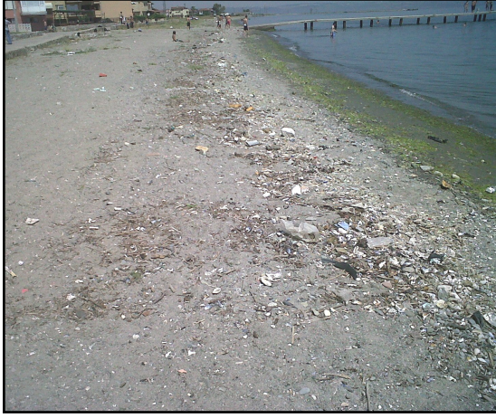
Cherrington kullanımı öncesi