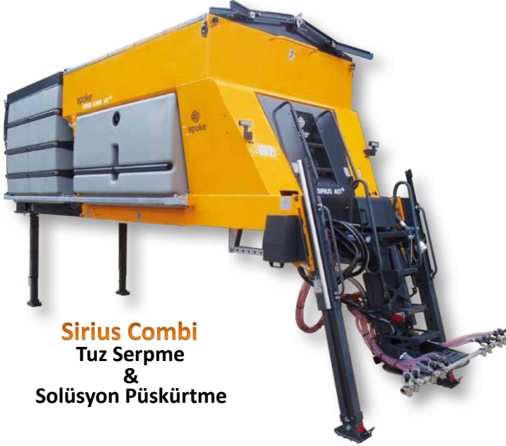
Sirius Combi Tuz Serpme & Solüsyon Püskürtme