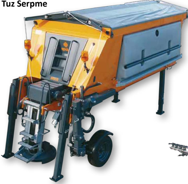
Sirius Tuz Serpme